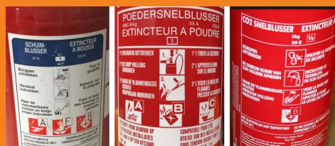
Fig. 5: Hoe hoger het getal voor de A of B, hoe groter het blusvermogen.

Er zijn verschillende brandklassen. Voor dakwerken zult u hoofdzakelijk te maken hebben met brandklasse A (vaste stoffen) en brandklasse B (vloeistoffen).