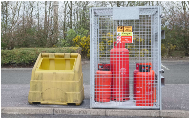
Fig. 4: Zowel bij propaangas als butaangas is het belangrijk dat u de gasflessen nooit in een kelder bewaart.