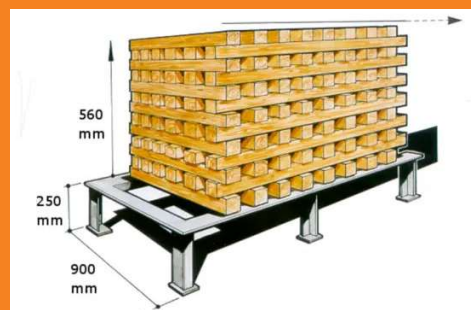
Fig. 6: Weergave test klasse A

Er bestaat een vaste rating om het blusvermogen of capaciteit op brandklasse A (vaste stoffen) en brandklasse B (vloeistoffen) te testen in brandproefopstellingen. Het resultaat kan enorm verschillen. Hoe hoger het getal voor de A of B, hoe hoger het blusvermogen.