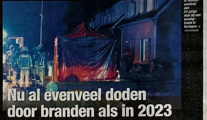
In februari overleed een 51-jarige man bij een woningbrand in Kuringen.

We zijn nog maar net halweg 2024, maar toch zijn er in Vlaanderen al 24 doden gevallen bij woningbranden. Dat is evenveel als in heel 2023. Brandpreventieadviseur Tim Ronders hamert opnieuw op het belang van rookmelders. "Maar overloop in de zomervakantie ook even een mogelijke evacuatie met je kinderen."