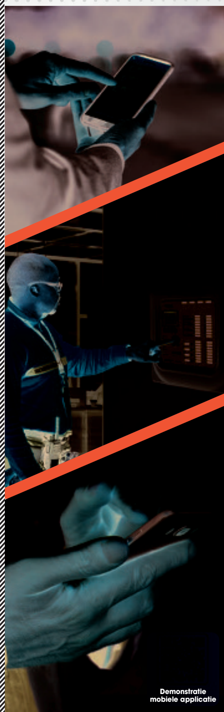
Demonstratie mobiele applicatie

Op elk moment via een applicatie op uw smartphone op de hoogte worden gebracht van een gebeurtenis op uw brandcentrale.