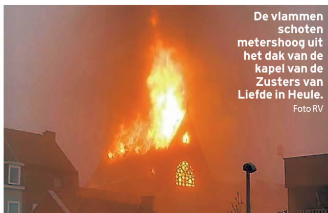
De vlammen schoten metershoog uit het dak van de kapel van de Zusters van Liefde in Heule.

In Heule, deelgemeente van Kortrijk, heeft gisterochtend een hevige brand gewoed in de kapel van het klooster van de Zusters van Liefde. De vlammen schoten metershoog de lucht in, 60 brandweermannen werden ingezet om het vuur te blussen. De neogotische kapel was niet meer te redden, en ook de zolder van het klooster ernaast is verwoest. Een drama voor de 21 zusters die er wonen. Eén van hen merkte iets na 6 uur de brand op nadat de stroom was uitgevallen. De zusters — de meesten tachtigers en sommigen flink daarboven — konden nog net op tijd geëvacueerd worden. In politiecombi's werden ze wat verderop naar een ander pand van de kloosterorde gebracht.